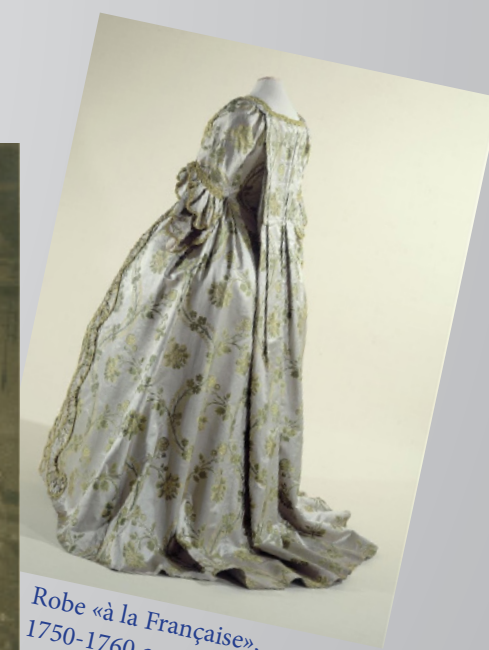
Robe «à la Française», 1750-1760 ca, Palais Galliera, Paris