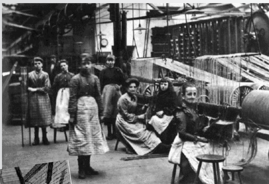
Dans un atelier de jute à Dundee en Ecosse vers 1900