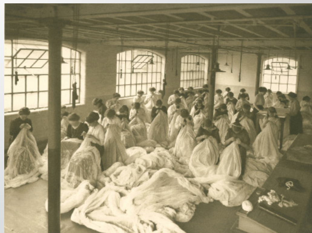
Birkin mending room, University of Nottingham BNN

9/9, Salle Marc Bloch, MSH de Lyon et Saint-Étienne, 14 avenue Berthelot 10/9, Amphithéâtre de la MILC, 25 rue Raulin, 69007 Lyon